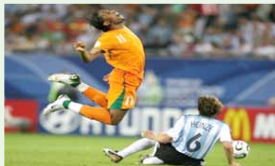
Fot. 2 Symulanta zdradza nienaturalne ułożenie ciała

Walka z plagą symulacji wymaga od wszystkich sędziów odwagi, konsekwencji i restrykcyjnego zachowania. Tylko przyjęcie jednolitej linii działania da efekty