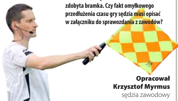
Opracował Krzysztof Myrmus sędzia zawodowy

30 Sędzia omyłkowo przedłużył czas gry drugiej połowy o 10 minut. W tym czasie udzielił dwa napomnienia oraz została zdobyta bramka. Czy fakt omyłkowego przedłużenia czasu gry sędzia musi opisać w załączniku do sprawozdania z zawodów?