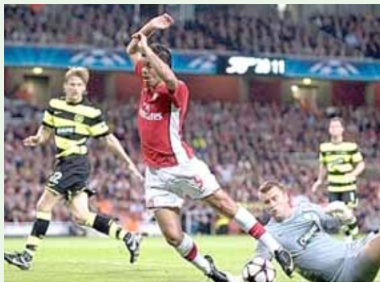
Fot. 1 Uwagę zwraca ułożenie rąk symulanta