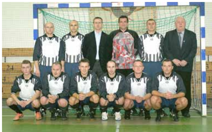
Zwycięska ekipa WS Sieradz. Turniej ukończyli z kompletem punktów i imponującym bilansem goli 11-1