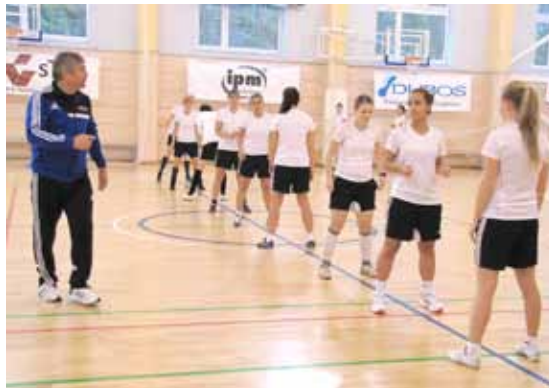
Trening praktyczny na sali

Program kursu miał charakter typowo szkoleniowy, zawierał wykłady na temat Przepisów Gry oraz z przygotowania fizycznego. Nie zabrakło również praktycznego szkolenia na polu gry i w hali. Słowacy zadbali nie tylko o poszerzenie naszej wiedzy teoretycznej i praktycznej, ale także o znakomitą