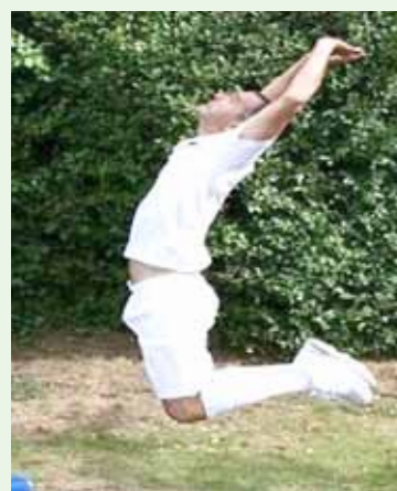
Tak wygląda sekwencja ruchów symulującego zawodnika

najpierw kierunku rzutu, a dopiero później rodzaj. Podczas całego zarządzania takimi sytuacjami sędziowie powinni również mieć na uwadze „ochronę” symulującego zawodnika, ze względu na chęć odwetu ze strony przeciwnika.